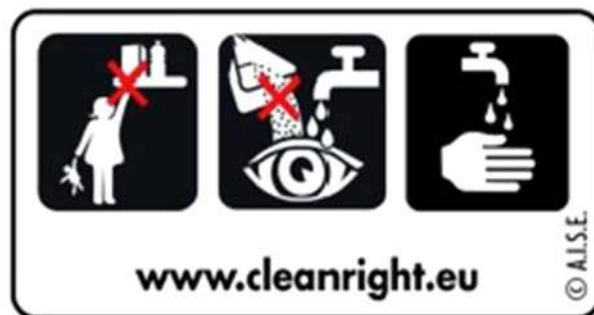
<그림> 그림기호 표시 예시