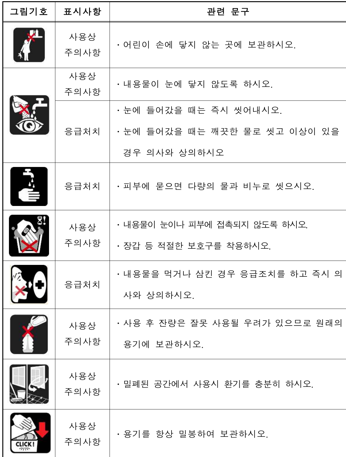
<표> 표시사항 문구별 그림기호 도안